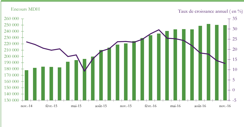
Graphique 3 : EVOLUTION DES RESERVES INTERNATIONALES NETTES